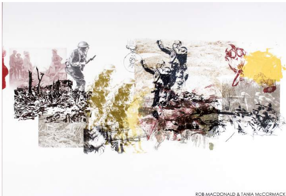
ROB MACDONALD & TANIA McCORMACK

Chaque semaine, un évènement de la 5 e Fête de l'estampe est mis en lumière