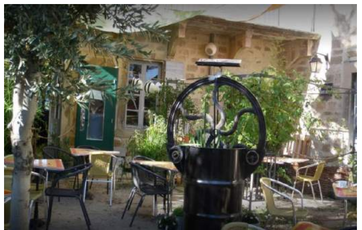
Librairie-musée Colophon – Maison de l'imprimeur