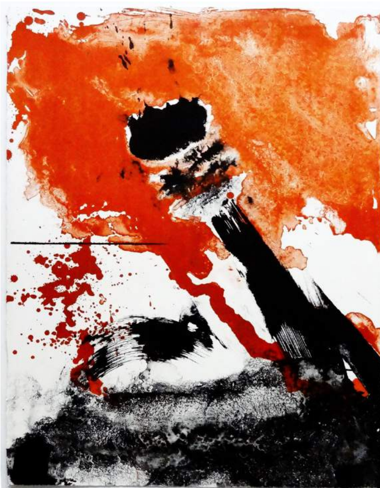
Serge Saunière Vive la couleur Lithographie 65 x 50 cm 1977 Atelier Pousse Caillou