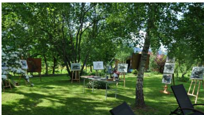
Visuel n° 8 - Fête de l'estampe 2016 - Exposition dans un jardin à Kruth (68)