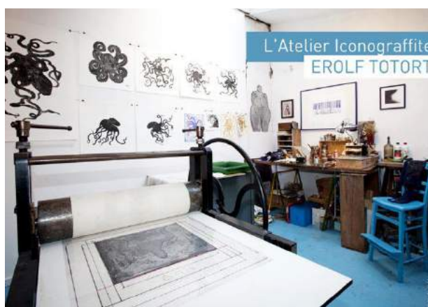
Visuel n° 5 - L'Atelier Iconograffite de Saint-Mandé (94)