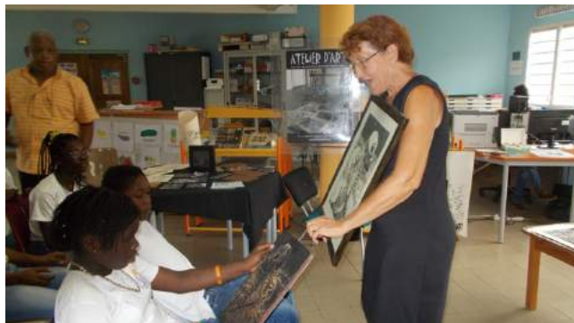
Visuel n° 10 – Intervention en 2016 au collège Front de mer à Pointe à Pître Guadeloupe (67)