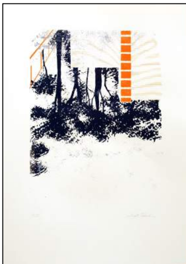
Visuel n° 7 – Margot Rebaud à Inkoozing Saint Etienne (42) – Sérigraphie 2 Crédits Margot Rebaud

Près de 230 événements pour une fête ouverte à tous