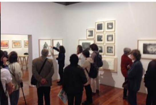
Conférence-visite exceptionnelle à la BnF