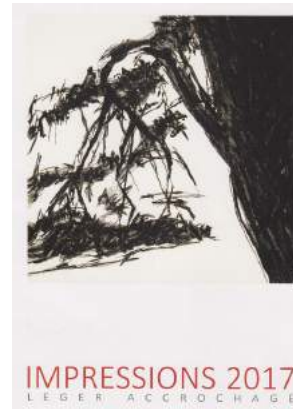
Visuel n° 12 – Florilège d'affiches de la Fête de l'estampe 2017

Pour disposer de ces visuels en haute définition contactez-nous : fetedelestampe@manifestampe.org ou tél. : 06 09 24 86 31