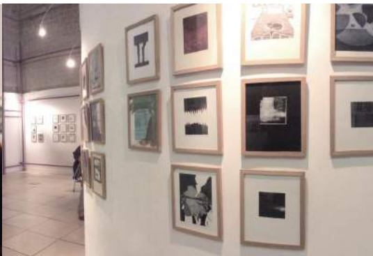
Biennale internationale de Dreux (27)