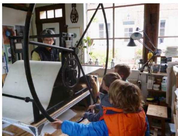
Visuel n° 6 - Atelier d'initiation pour enfant à Noailles (60)