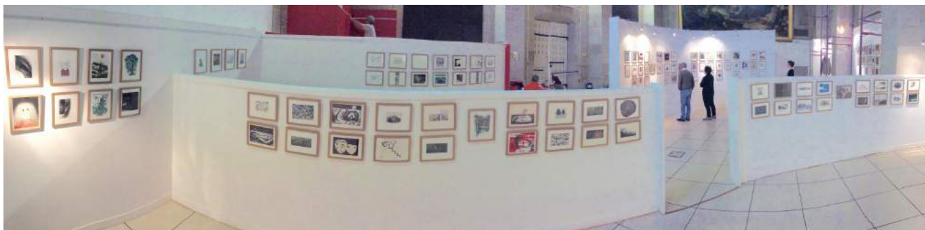
Visuel n° 11 – Biennale de Dreux (28) en 2016