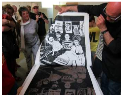
Impression à Ploemeur (56)