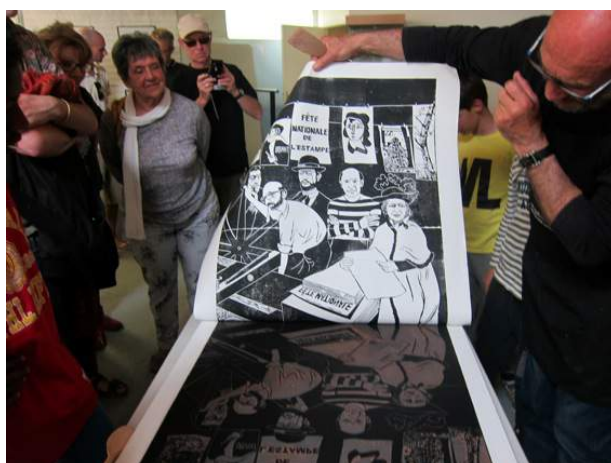
Visuel n° 9 – Fête de l'estampe 2016 à Ploemeur (56) - impression d'une xylographie collective